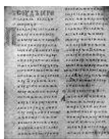
Двинская уставная грамота

Лихоимец – жадный вымогатель, взяточник».