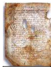
Псковская судная грамота

Двинская уставная грамота 1397 года. Мздоимство упоминается в русских летописях XIV века, например в Двинской уставной грамоте 1397 года в статье 6: «А самосуда четыре рубли, а самосуд то: кто изыснав татя с поличным, да отпустит, а себе посул возьмет, а наместники доведаются по заповеди, ино то самосуд, а опричь того самосуда нет». Там же, в статье 8: «...а черес поруку не ковати, а посула в железех не просити; а что в железех посул, то не в посул».